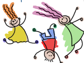
Nuoret sankarikehittäjät (yliopistoissa)

Opiskellen ja työtä tehden Amk-opettajaksi